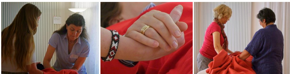
Eindrücke vom Energie-Tag am 24. Mai 2014

Wir spenden unsere Zeit, Können und Erfahrung; von Ihnen erbitten wir eine Spende ab 30,00 Euro, gerne auch mehr (25,00 Euro bei Personen mit niedrigem Einkommen), für die Stiftung Das neue Hauner (Bau der neuen Kinderklinik).